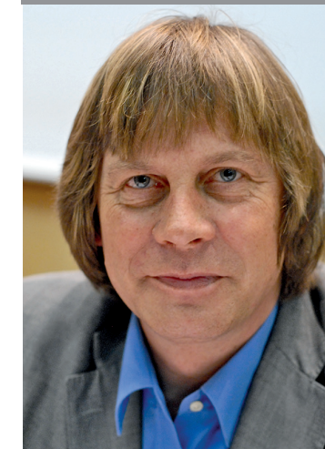
Bernard Thibault, secrétaire général de la CGT

A l'issue d'une négociation laborieuse avec les organisations patronales, un accord a été conclu avec des syndicats de salariés. Le journal que vous avez entre les mains a pour objectif de vous informer, de vous alerter, mais aussi d'en appeler à votre intervention avant que de mauvaises décisions ne soient prises. En prenant connaissance de