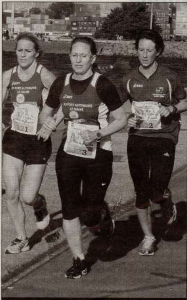
L'équipe féminine du LHASA victorieuse