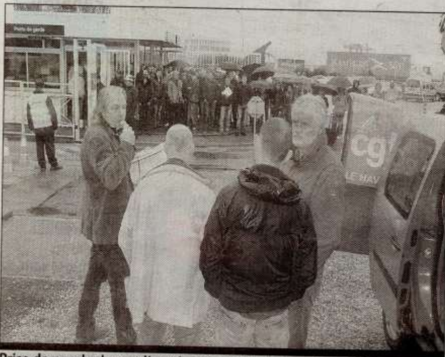
Prise de parole devant l'entrée principale de la centrale EDF

Enfin, les syndicats réitèrent leur demande d'un nouveau moyen de production charbon fortement dépollué pour pérenniser le site du Havre.