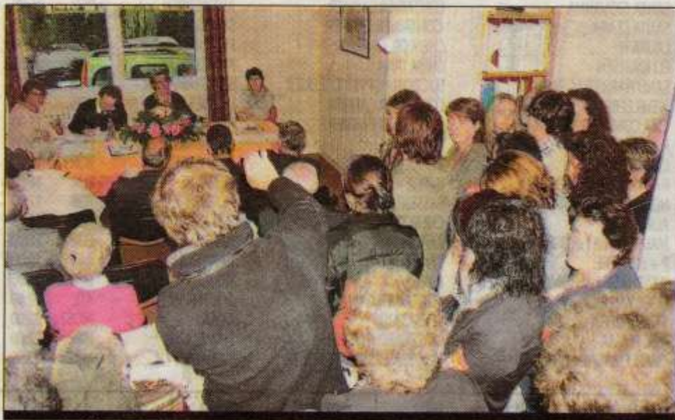
Les salariés grévistes se sont invités à l'assemblée générale, hier

Face à cette impasse, la CGT de l'action sociale compte solliciter le Département, principal financeur de l'association. « Officiellement, ils ne peuvent pas s'ingérer, mais nous savons que des élus partagent notre point de vue sur la situation », confie un syndicaliste.